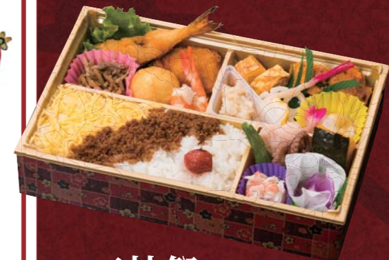
三社祭 〈さんじゃまつり〉 二、〇〇〇円