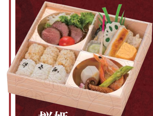
桜姫 〈さくらひめ〉 一、五〇〇円

※博多座花幸弁当は、ご希望日の5日前の御予約で10個以上から承ります。すべて税別価格です。