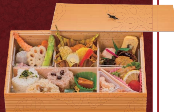
勧進帳 〈かんじんちょう〉 三、〇〇〇円