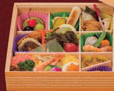
連獅子 〈れんじし〉 三、〇〇〇円