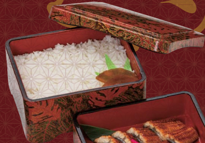
◆ うなぎ二段重 一、八〇〇円