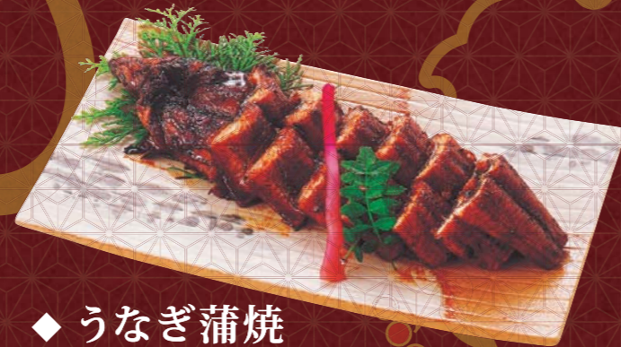
◆ うなぎ蒲焼 一、八〇〇円