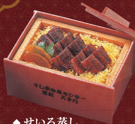
◆ せいろ蒸し 二、〇〇〇円