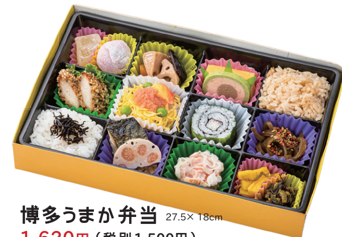
博多うまか弁当 27.5×18cm 1,620円(税別1,500円)