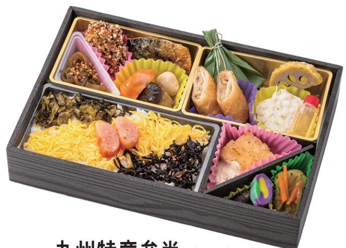
九州特産弁当 25.5×17cm 1,836円(税別1,700円)