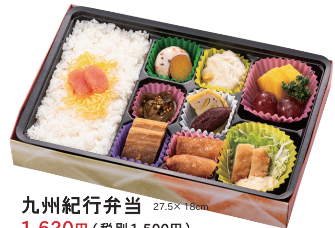
九州紀行弁当 27.5×18cm 1,620円(税別1,500円)

(熊本) 辛子蓮根 (宮崎) チキン南蛮 (佐賀) いか焼売 (長崎) 中華春巻など 九州8県の名産入り。