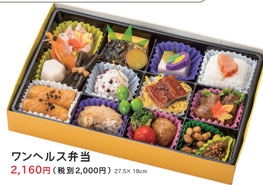
ワンヘルス弁当 27.5×18cm 2,160円(税別2,000円)