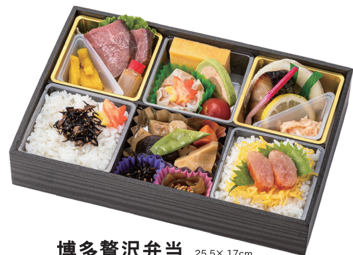
博多贅沢弁当 25.5×17cm 2,376円(税別2,200円)