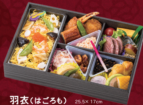
羽衣(はごろも) 25.5×17cm 2,700円(税別2,500円)