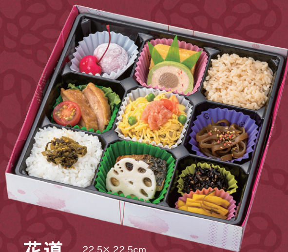
花道 22.5×22.5cm 1,296円(税別1,200円)