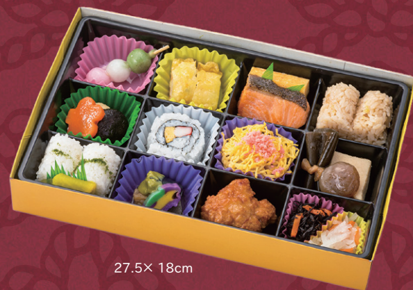
ごひいき弁当～幸～ 27.5×18cm 1,404円(税別1,300円)