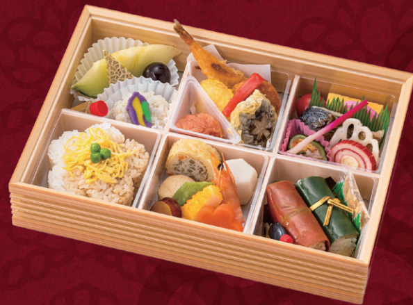
賑わい(にぎわい) 28.3×20cm 3,348円(税別3,100円)