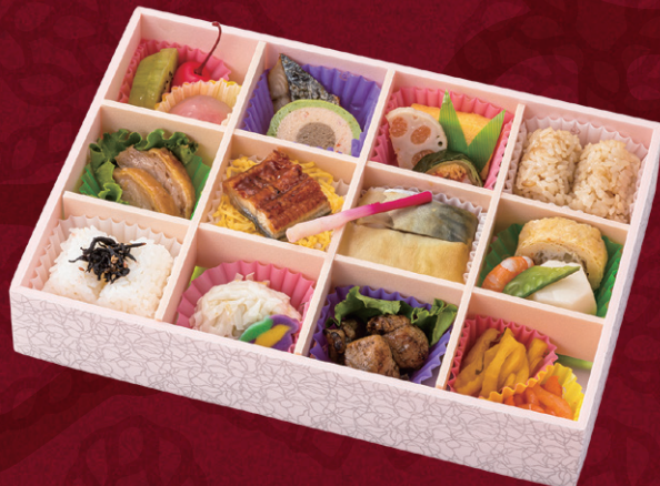
隅田川 27×18.5cm 2,700円(税別2,500円)