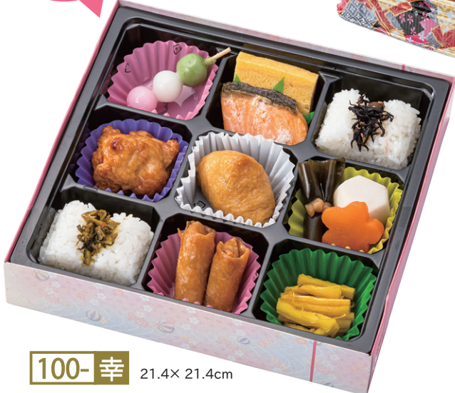
100- 幸 21.4× 21.4cm ※いなり寿司はちらし寿司に変更可能です。