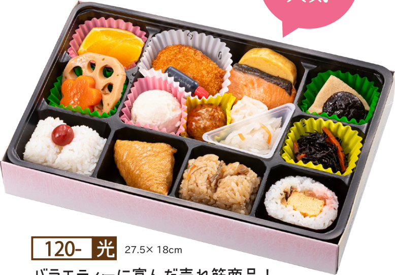
120- 光 27.5× 18cm バラエティーに富んだ売れ筋商品！