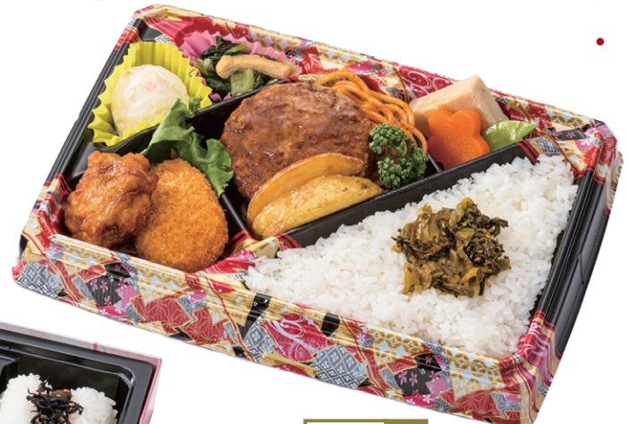
100- 宝 26× 18cm 人気のハンバーグ弁当！