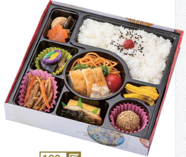
100- 匠 19.5× 19.5cm 真ん中にチキン南蛮が入ってます。