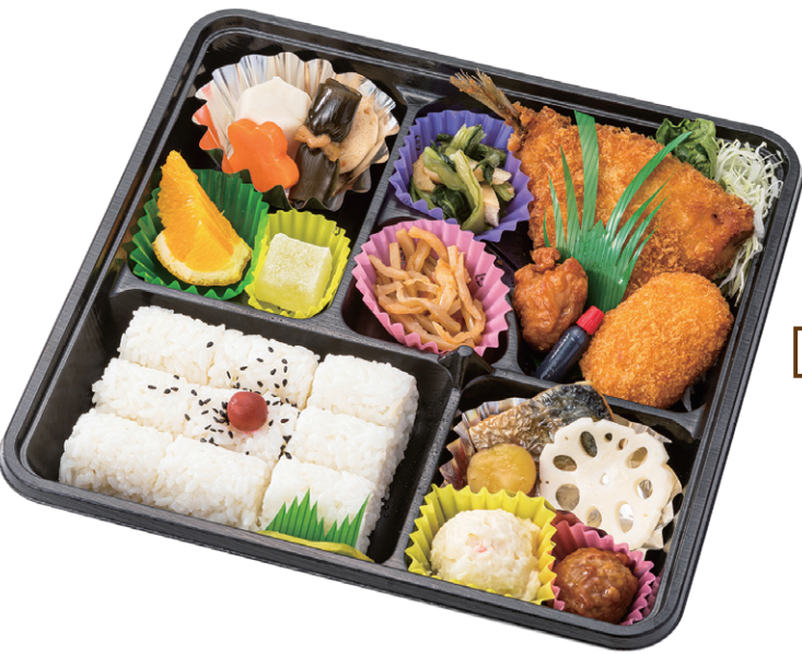
120- 福 27× 27cm