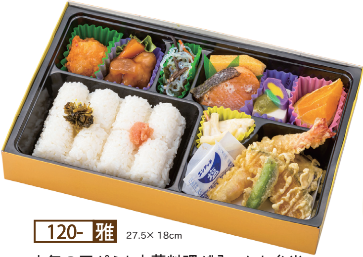
120- 雅 27.5× 18cm 人気の天ぷらと中華料理が入ったお弁当。