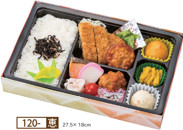
120- 恵 27.5× 18cm 若い方に喜ばれるトンカツ入り。