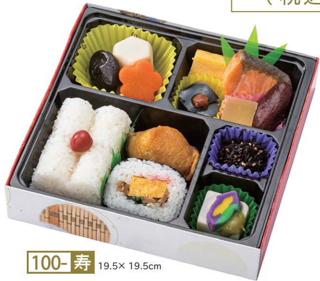
100- 寿 19.5× 19.5cm 女性に好評！