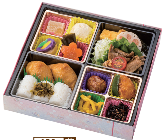
120- 花 21.4× 21.4cm 女性の集まりにオススメ。