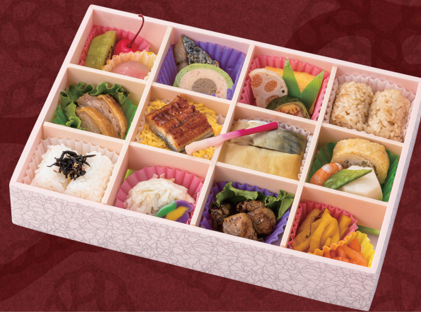
隅田川 27× 18.5cm 2,160円 (税別 2,000円)