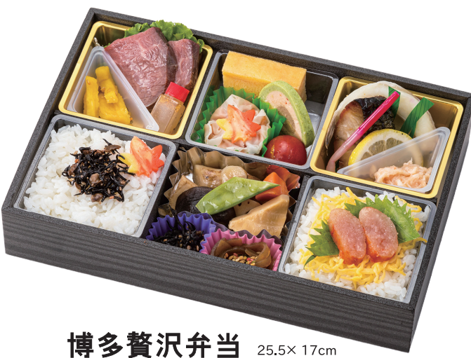
25.5× 17cm 博多贅沢弁当 2,160円 (税別 2,000円)