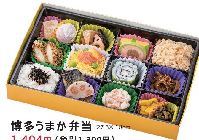
博多うまか弁当 27.5× 18cm 1,404円 (税別 1,300円)