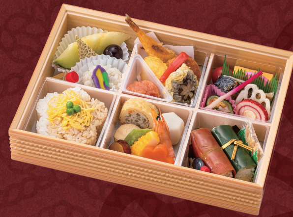
賑わい(にぎわい) 28.3× 20cm 3,240円 (税別 3,000円)