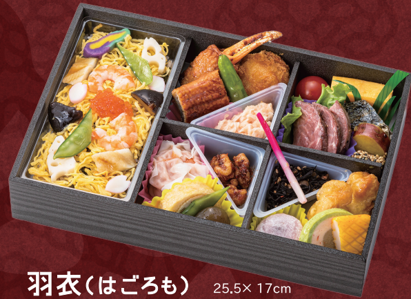
羽衣(はごろも) 25.5× 17cm 2,484円 (税別 2,300円)