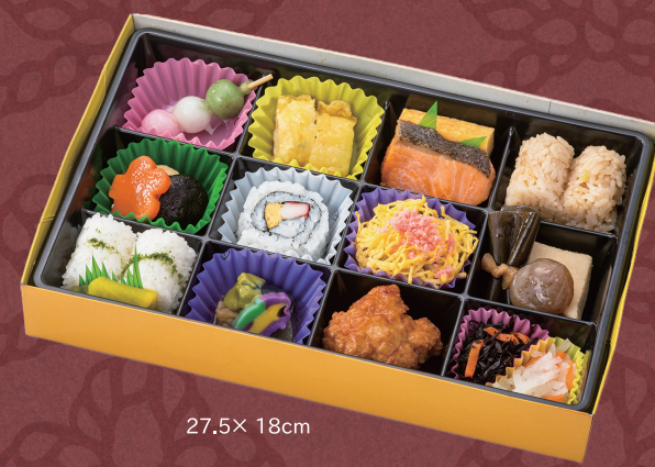
27.5× 18cm ごひいき弁当～幸～ 1,296円 (税別 1,200円)