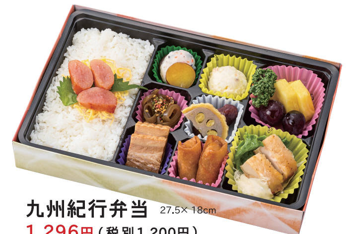
九州紀行弁当 27.5× 18cm 1,296円 (税別 1,200円)

(熊本) 辛子蓮根 (宮崎) チキン南蛮 (佐賀) いか焼売 (長崎) 中華春巻など 九州8県の名産入り。