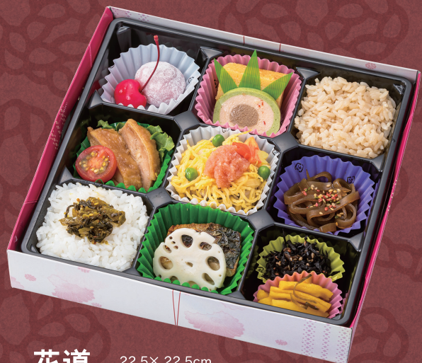
22.5× 22.5cm 花道 1,080円 (税別 1,000円)