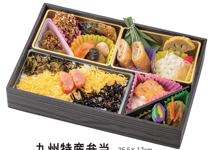
25.5× 17cm 九州特産弁当 1,620円 (税別 1,500円)