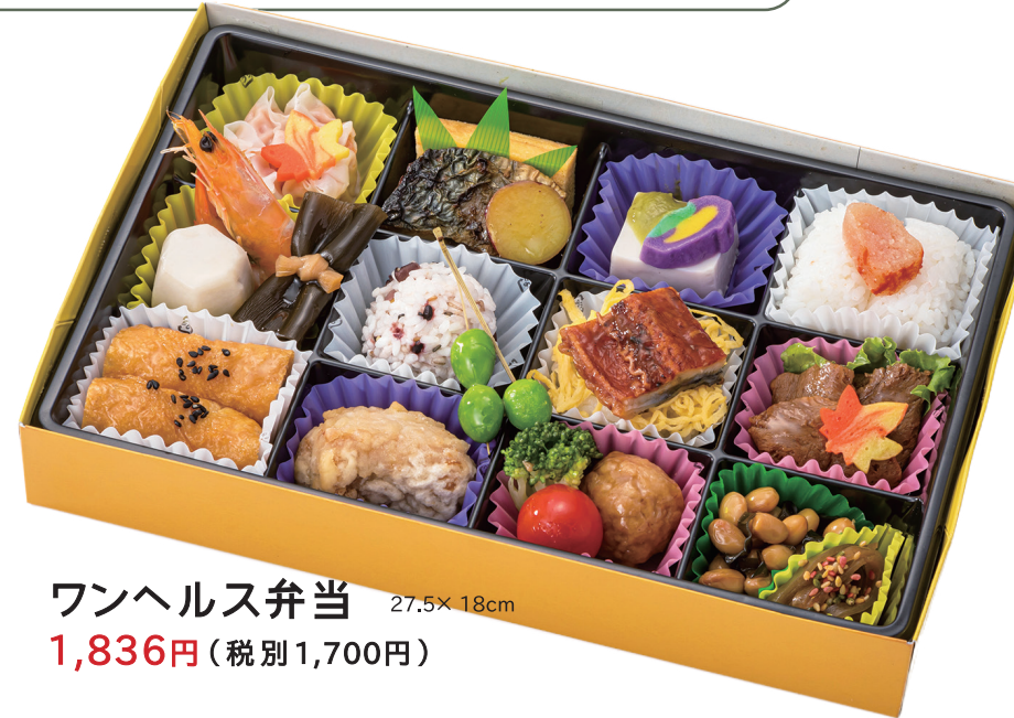
ワンヘルス弁当 27.5× 18cm 1,836円 (税別 1,700円)