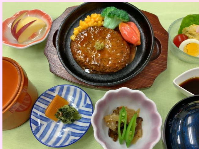
和風ハンバーグ御膳 2,000円